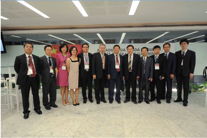
拉美所学术代表团成功出访巴西和哥斯达黎加