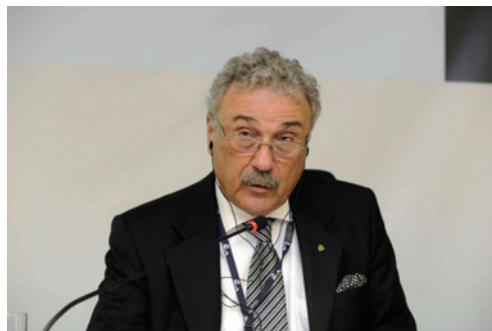
瓦加斯基金会巴西经济研究所所长路易斯·施穆拉教授

随后，瓦加斯基金会巴西经济研究所所长路易斯·施穆拉教授、瓦加斯基金会国际处处长比阿诺·塞尔萨·卡坎蒂，中国前驻巴西大使、拉美所巴西研究