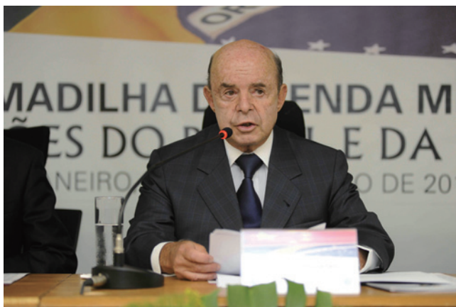
巴西联邦参议员兼FGV副主席弗朗西斯科·多内莱斯致辞

角”主题研讨会，二是中国社科院与巴西瓦加斯基金会签订战略合作协议，三是中国社科院拉美所和瓦加斯基金会巴西经济研究所的合作成果《中等收入