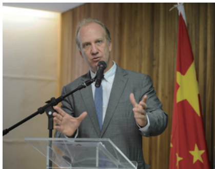
巴西战略事务部部长马塞罗·耐里致开幕辞

会议的第三项议程是两国学者从巴西和中国的视角谈“中等收入陷阱”问题。在第一单元，瓦加斯基金会经济研究所的莉阿·佩莱拉研究员分析了巴西的经济增长态势。她介绍了巴西经济增长的历史，着重分析了不同时期的经济增长的动力。她认为，巴西经济增长已从进口替代模式，向创新要素转化，