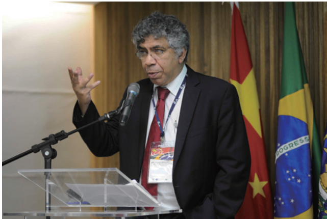
世界银行发展经济部“金砖经济体”高级顾问奥达维罗诺·卡努多致闭幕辞

最后，世界银行发展经济部“金砖经济体”高级顾问奥达维罗诺·卡努多先生以“‘中等收入陷阱’：结论方式”为题作了闭幕发言。卡努多先生比