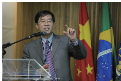
北京师范大学中国收入分配研究院院长发言