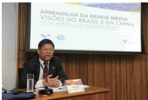
中国前驻巴西大使陈笃庆致辞

中心主任陈笃庆先生先后致辞。他们在发言中回顾了中巴合作的历史，介绍了中国投资进入巴西市场的现况。他们一致认为中国社科院和瓦加斯基金会的合作标志着中巴两国的深化，这种合作比经贸合作更加重要；而在如何推动经济发展、优化社会治理体