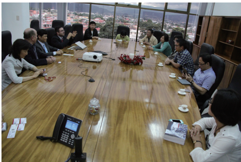
国泰银行埃罗总经理向代表团介绍哥经济和营商环境