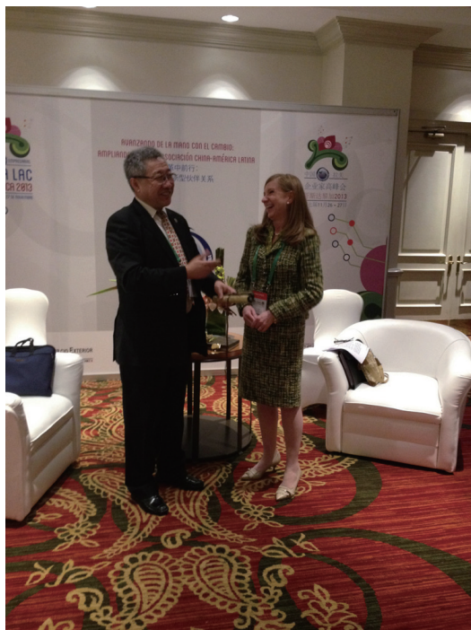
郑秉文所长同 哥斯达黎加对外经贸部部长安娜韦列·冈萨雷斯女士愉快地交谈

2013年11月26日，在赴哥斯达黎加参加第七届中拉企业家峰会间隙，率团与会的拉美所所长郑秉文教授会见了哥斯达黎加对外经贸部部长安娜韦列·冈萨雷斯女士，双方进行了友好的交谈，并探讨了未来合作的计划。陪同会见的有拉美所社会文化室副主任房连泉博士、中国驻哥斯达黎加大使馆教育专员杨明博士，以及哥斯达黎加对外贸易部副部长和外事部门负责人等。