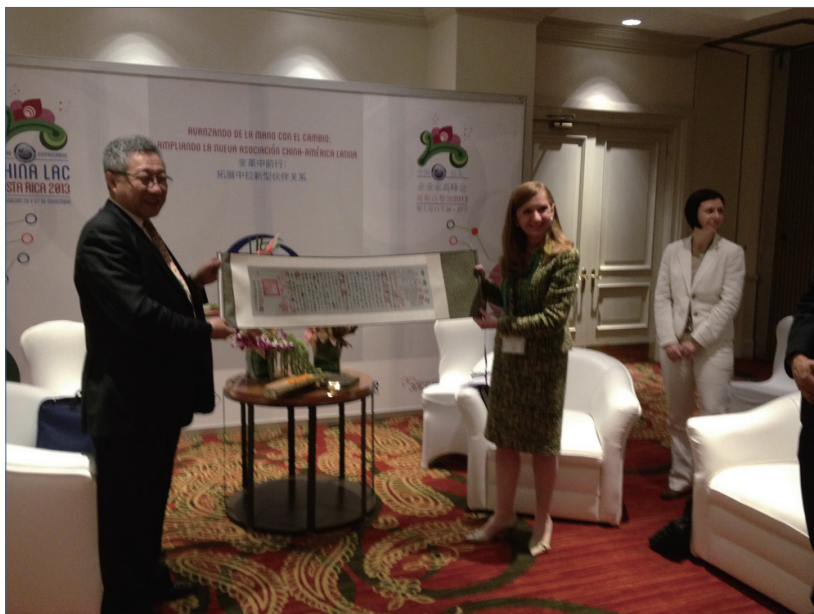
郑秉文所长向哥斯达黎加对外经贸部部长安娜·韦列·冈萨雷斯女士赠送礼物

本届中拉企业家峰会表示感谢，之后她介绍了哥斯达黎加国内的经济发展和外贸形势，表达了对中方参加哥斯达黎加自由贸易区建设的期望，并建议就该问题召开一次中-哥研讨会。