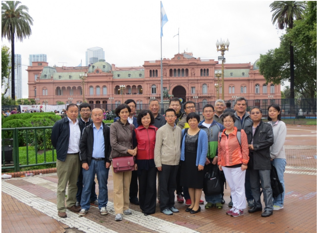
图为代表团在阿根廷总统府前合影

1910年，为了庆祝阿根廷独立100周年，市议会决定仿效巴黎，修建地下铁路系统和一个由从市中心辐射出去的宽阔大道组成的交通网络。布市现有的五条地下铁路中，四条都建于这一时期，只有一条是在第二次世界大战结束后修建的。城市中心的宽阔大道多是在20世纪20和30年代修建的，按照巴黎香舍里榭大道的模式，每隔四条街修建一条东西走向的大道，每隔十条街修建一条南北走向的大道，而且规定要修建全世界最宽阔的大道。其中1937年10月正式通车的7月9日大道穿过市中心，据称至今仍是世界上最宽的城市大道。