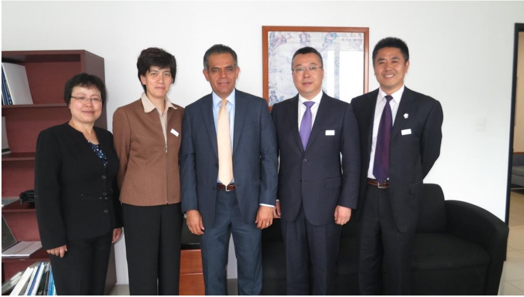
（美墨调研团杨志敏供稿）

代表团一行与伊达尔戈博士就发展中墨经贸关系尤其是双边贸易和相互投资等问题进行了座谈和交流。