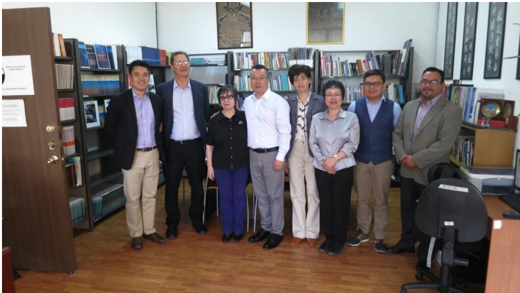
（美墨调研团杨志敏供稿）

作为研究中墨、中拉经贸关系的专门研究机构，墨国立自治大学中国墨西哥研究中心在本国和拉美地区构建了广泛的学术网络，具有相当的影响力。